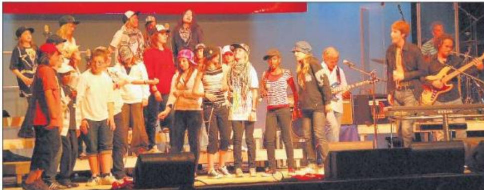
Der Chor mit Deean überzeugte die Jury am meisten: Er holte sich den Sieg vor den anderen vier Kinderchören – allerdings denkbar knapp.

Spannung pur im randvollen Stadthofsaal Uster am Sonntagabend: Welche Band mit ihrem 25-köpfigen Kinderchor wird am Open-Air Hoch-Ybrig einen Auftritt haben dürfen?