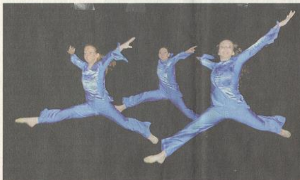
Expression Dance verbindet Live-Musik und Tanz auf der Bühne.

Der Tonträger enthält 15 selbst geschriebene Songs, mit Texten, die etwa je zur Hälfte in Englisch und Schweizerdeutsch gesungen sind. Sie werden an den beiden Auftritten von Deean und seinen Bandkollegen, alles Spitzenmusiker, live zu hören sein.