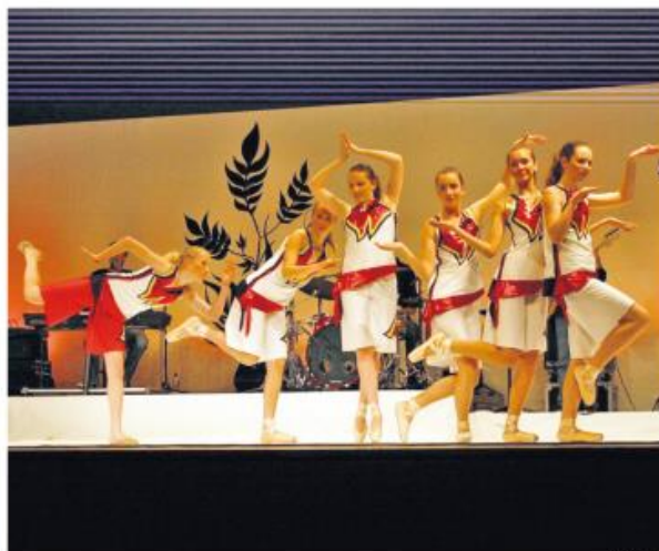
Expression Dance begeisterte mit einer abwechslungsreichen Choreografie.